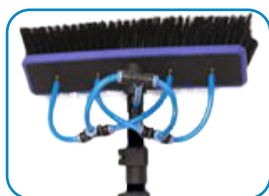
Lanca teleskopowa ze szczotką