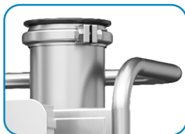
Rama ze stali nierdzewnej