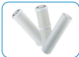
3 wkłady: wstępny, węglowy i DI