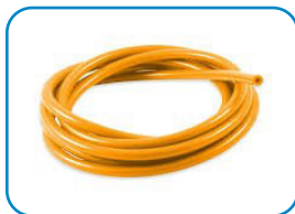
Wąż podłączniowy – 50 m